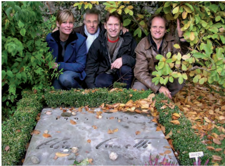
Bij het graf van Elias Canetti, Zürich