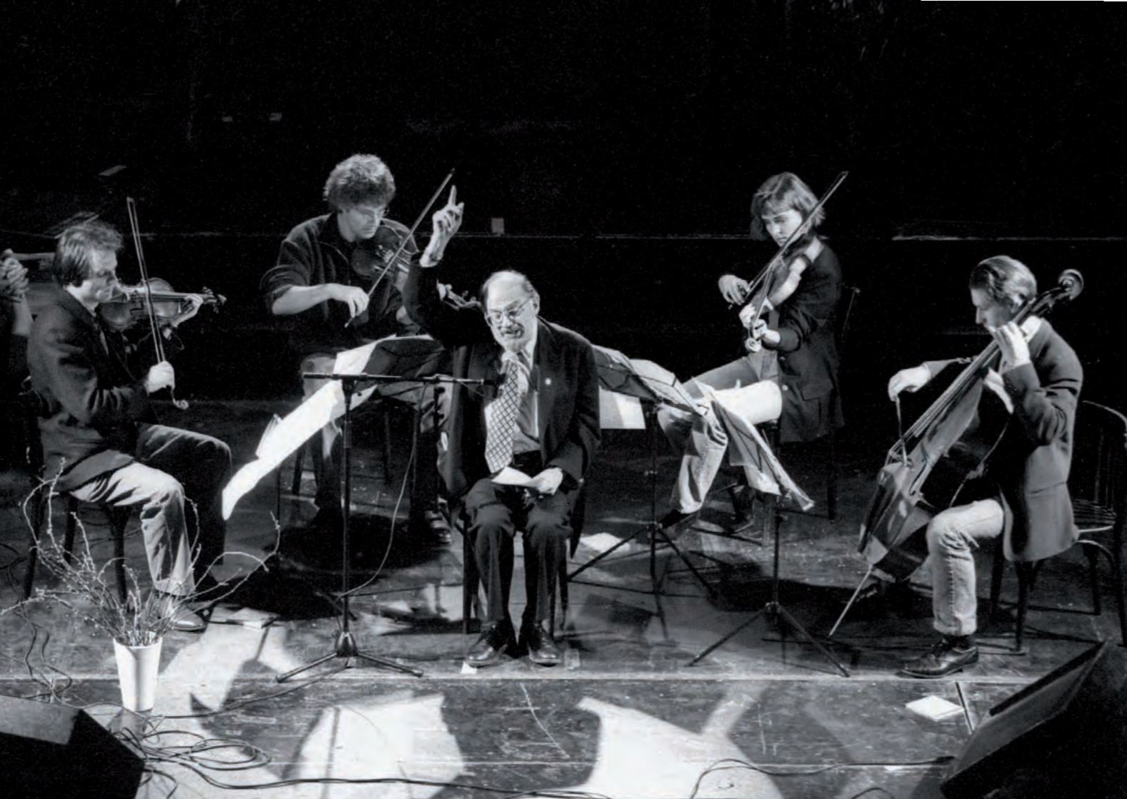
Links Met Allen Ginsberg in Paradiso