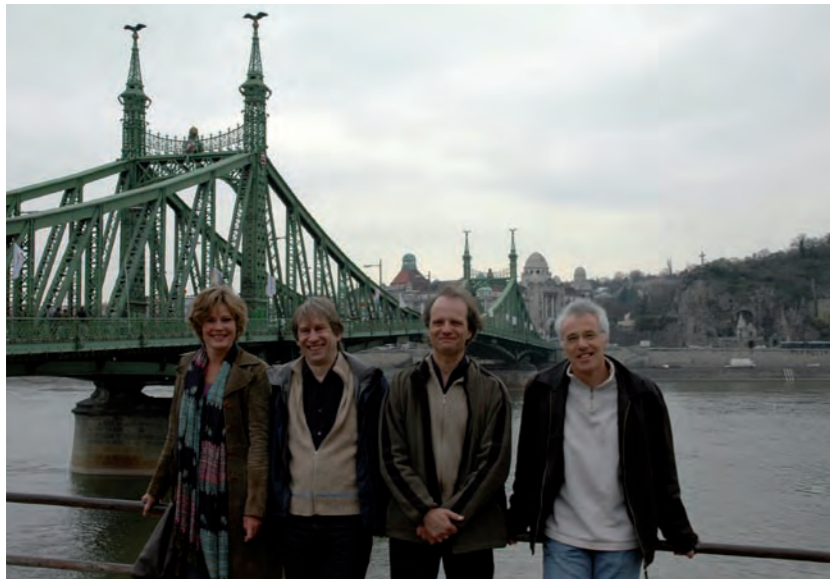
Aan de Donau (Budapest)