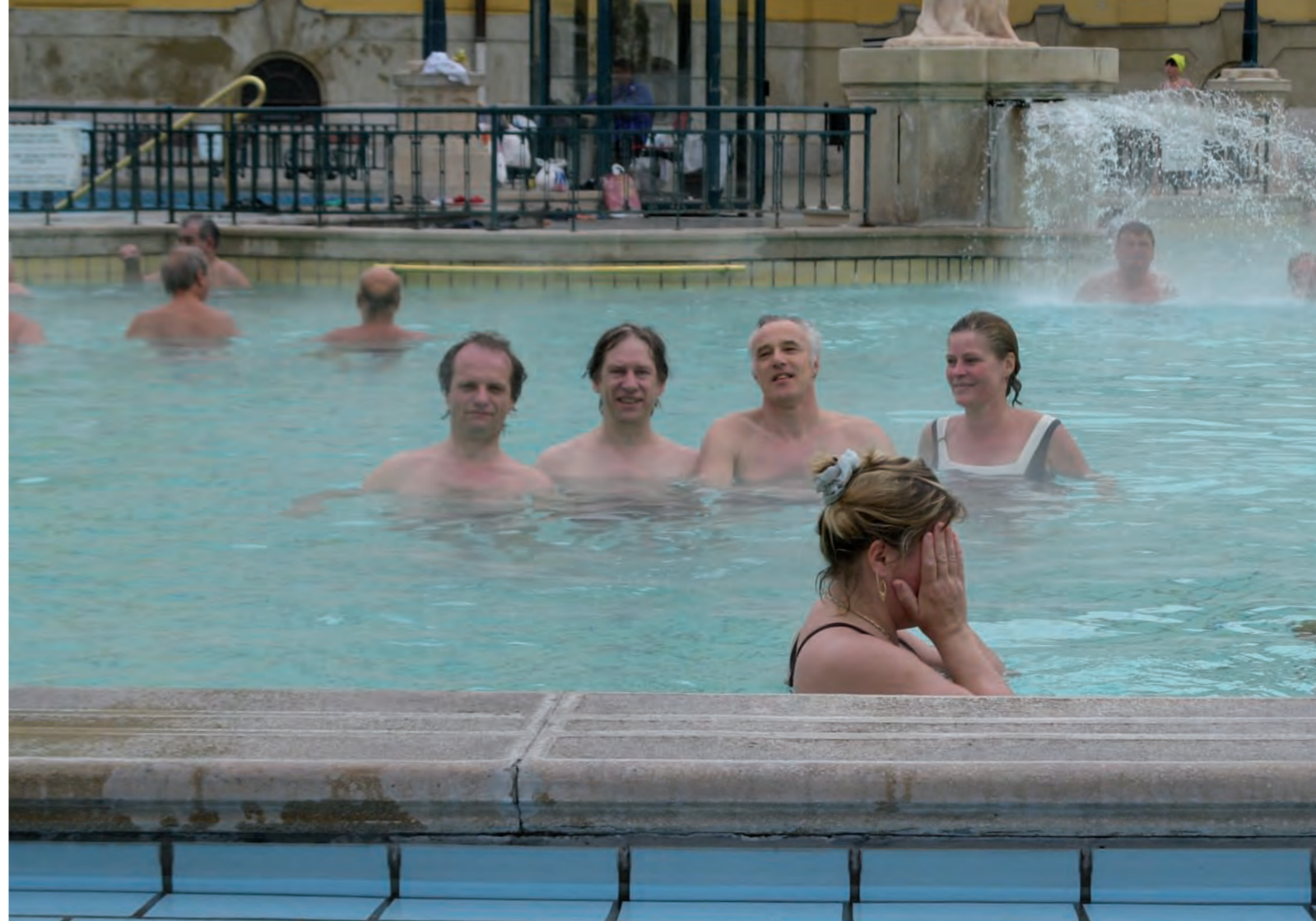
Széchenyi badhuis, Budapest