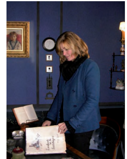
Woonhuis van Maurice Ravel in Montfort l'Amaury