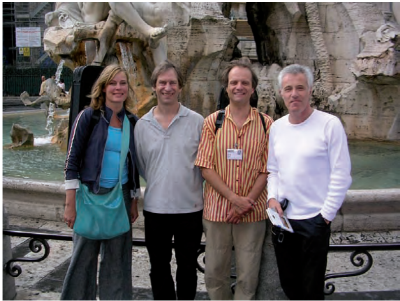
Trevi fontein, Rome